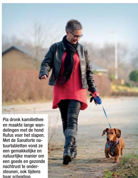
Pia dronk kamillethee en maakte lange wandelingen met de hond Rufus voor het slapen. Met de Sanaforte natuurtabletten vond ze een gemakkelijke en natuurlijke manier om een goede en gezonde nachtrust te ondersteunen, ook tijdens haar scheiding.